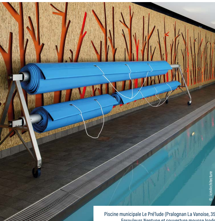
Piscine municipale Le Pré'lude (Pralognan La Vanoise, 35) Enrouleurs Neptune et couverture mousse Isodel