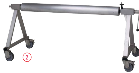
Enrouleur JUPITER : pour piscine jusqu'à 8x50 m ① Version motorisée ② Version manuelle

Les enrouleurs Neptune et Jupiter, le complément indispensable à la couverture mousse ISODEL