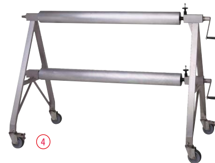
Enrouleur NEPTUNE : pour piscine jusqu'à 16x25 m ③ Version motorisée ④ Version manuelle