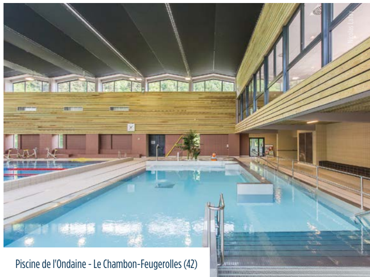
Piscine de l'Ondaine - Le Chambon-Feugerolles (42)

La partie supérieure de la paroi est profilée à la demande pour créer un accroche doigt élégant et personnalisé assurant la stabilisation du plan d'eau. L'eau de débordement est réceptionnée dans une goutte au profil spécifique, dimensionnée pour l'hydraulique du bassin, définie en relation avec le lot technique Traitement d'Eau. Un soin tout particulier est apporté au traitement de l'interface avec les plages périphériques.