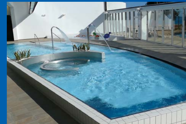
Complexe aquatique Roquebrune Cap Martin - Coste Architecture Technologie INOXINOV', INOX + Membrane PVC armée