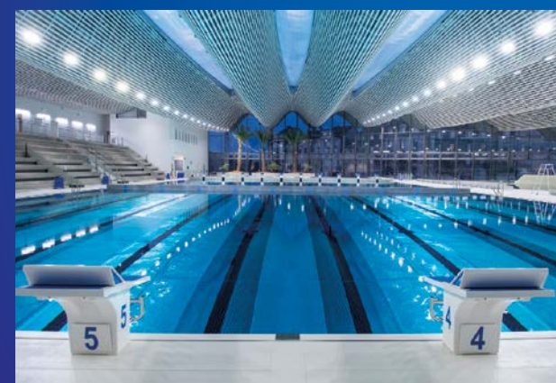
Complexe UCPA Sport Station Grand Reims - Architecte MIMRAM Technologie INOXEO, 100% INOX