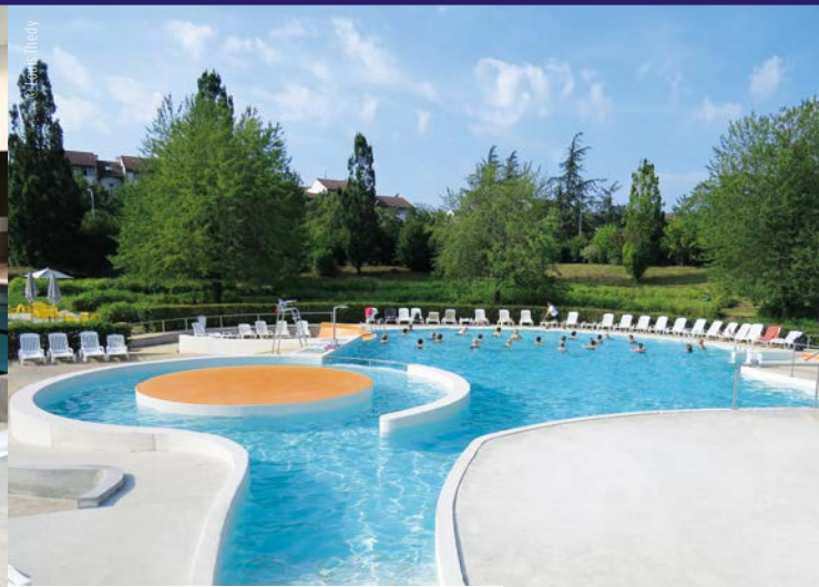
Centre Aquatique Le Nautil - Villefranche-sur-Saône (69)