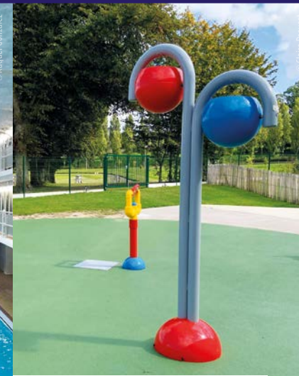
Centre Aquatique Vire Normandie - Vire (14)