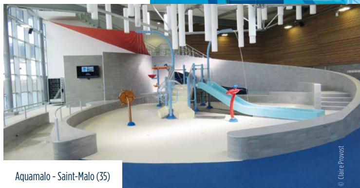
Aquamalo - Saint-Malo (35)