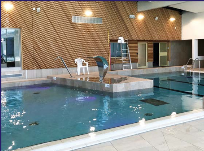
Centre Aquatique du Pays de Craon - Craon (53)