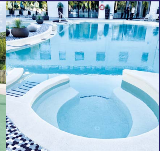
Les Bains d'Arguins - Arcachon (33)