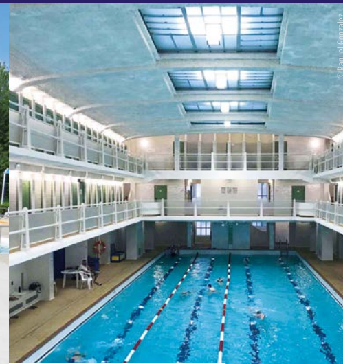
Piscine des Amiraux - Paris (75)