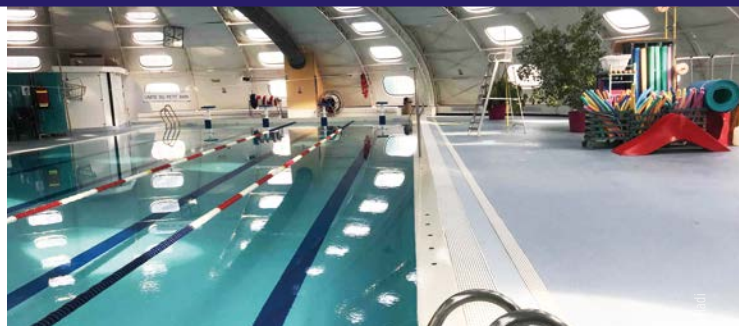
Piscine de Porcheville - Porcheville (78)

Possibilité de déposer le carrelage sur un seul côté : dans le cas notamment de bassins certifiés pour la compétition.