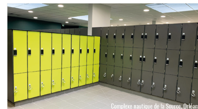
Complexe nautique de la Source, Orléans