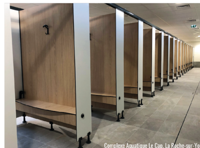
Complexe Aquatique Le Cap, La Roche-sur-Yon

Straté ® Agencement de vestiaires et d'espaces